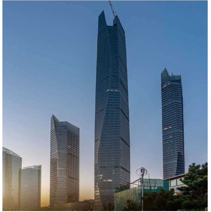
QINGDAO HAITIAN CENTER