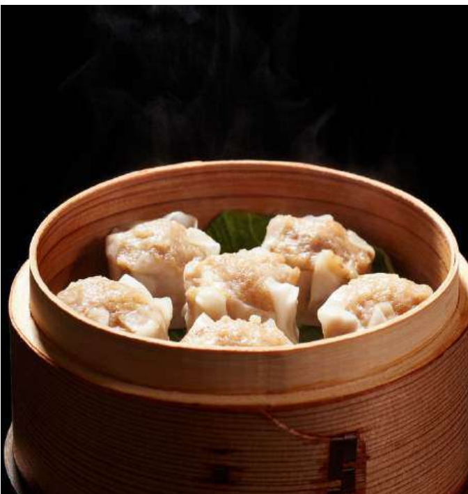
DIM SUM RESTAURANT