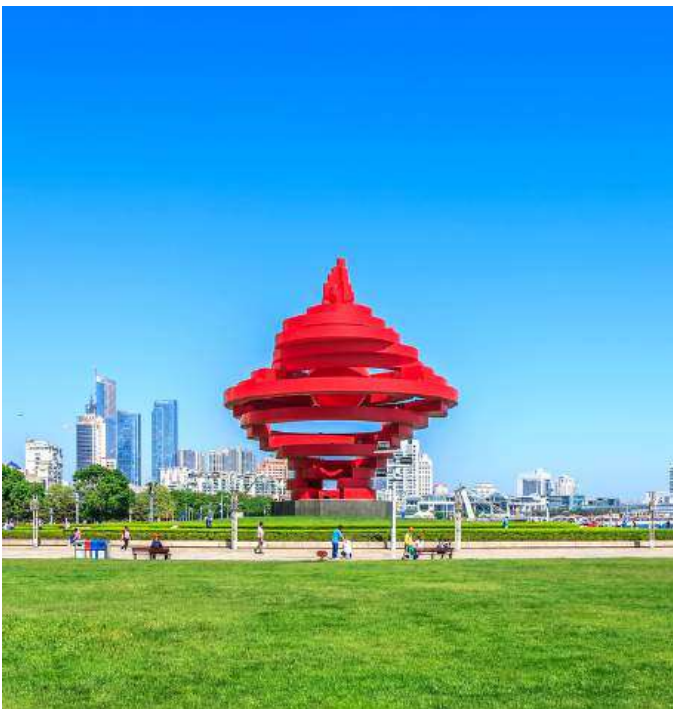
MAY FOURTH SQUARE