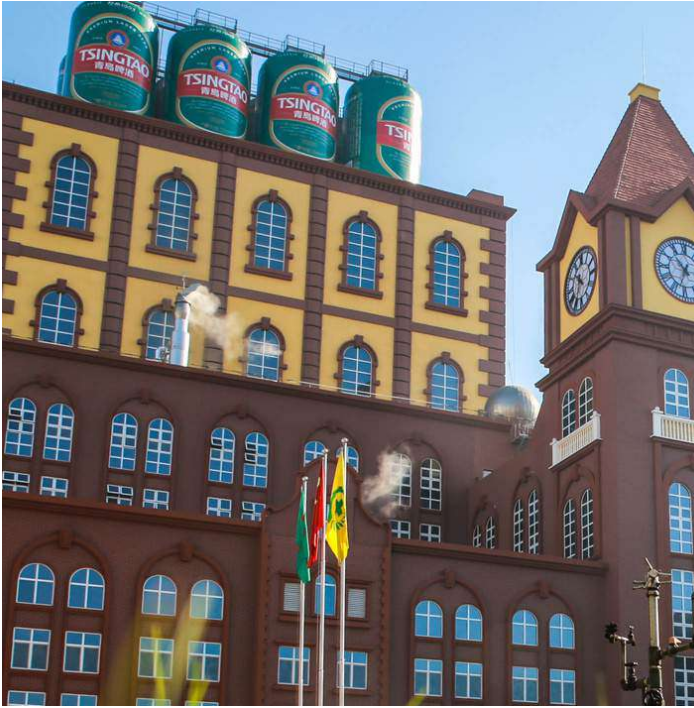
TSINGTAO BEER MUSEUM