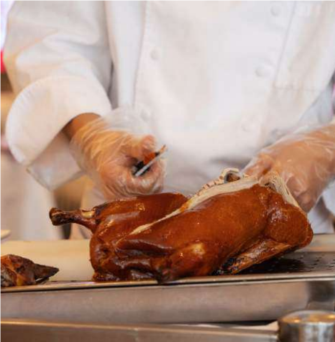
PEKING DUCK RESTAURANT