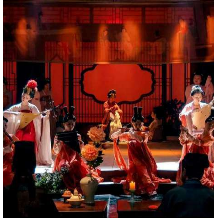
IMMERSIVE IMPERIAL RESTAURANT