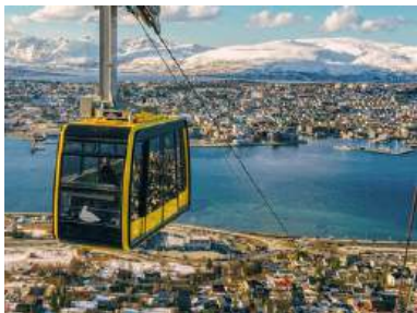
FJELLHEISEN CABLE CAR