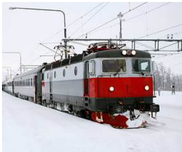
ARCTIC CIRCLE TRAIN FROM KIRUNA