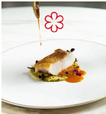
ONE MICHELIN STAR RESTAURANT