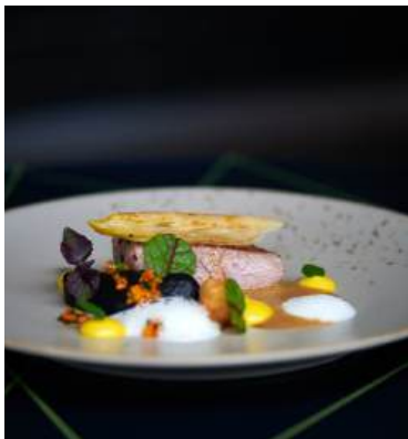
FINE DINING RESTAURANT