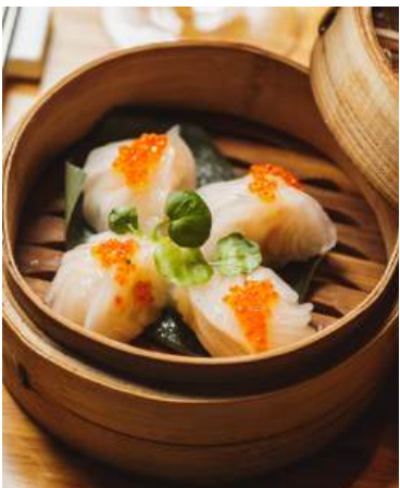
DIM SUM RESTAURANT